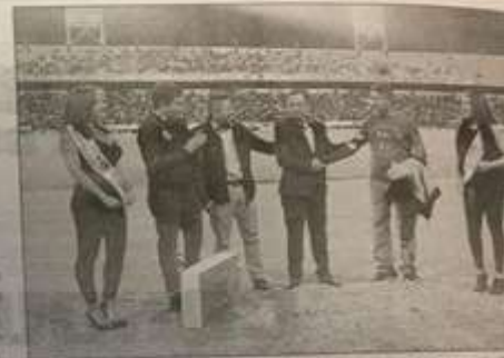
Entrega de una de las prótesis, durante un partido de Mineros de Zacatecas.

se le complicaba hacer cosas tan sencillas como sostener dos objetos en ambas extremidades. Y el día que se le dio que recibiera su prótesis, sintió alegría, pero nerviosismo a la vez. "Me siento muy afortunada de ser parte de las personas que reciben esta prótesis, porque para nosotros representa una oportunidad increíble. En mi caso me da la oportunidad de volver a hacer las actividades que realizaba hace 10 años. Siento de nuevo esa ilusión por hacer cosas," dice. Frausto recordó que el primer